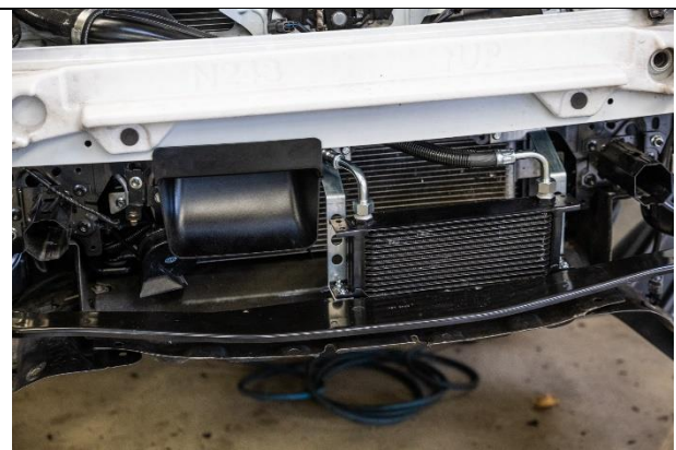
Umgesetzter Ölkühler (falls montiert)