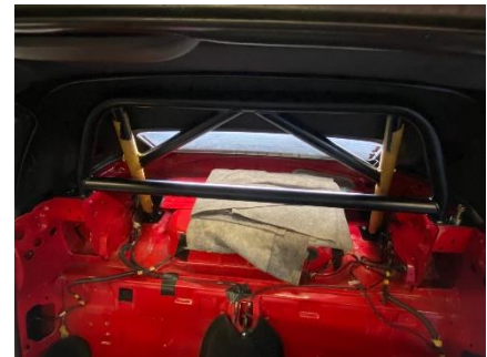
SPS Motorsport - Überrollbügel Montagehinweis: